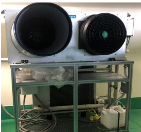
写真はデモ機となります。